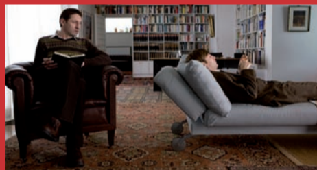
05.03. GANZ NAH BEI DIR Vicinissimo a te (t.l.) di Almut Getto, Germania 2007, 88'