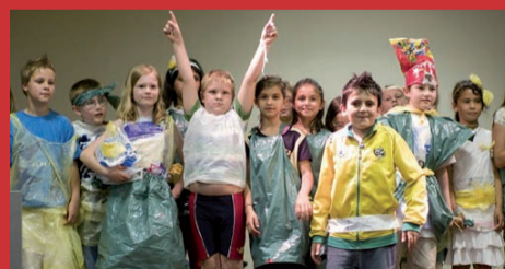
26.03. BERG FIDEL - EINE SCHULE FÜR ALLE Berg Fidel - Una scuola per tutti (t.l.) di Hella Wenders, Germania 2012, Documentario, 87'

La vita del solitario impiegato di banca Philip segue ogni giorno la stessa routine, divisa tra casa, lavoro e piccoli rituali insensati. La sua vita riceve uno scossone quando un giorno trova la sua casa scassinata. Sarà, tuttavia, il conseguente incontro con Lina, violoncellista non vedente dal carattere allegro ed estroverso, a mettere davvero sottosopra il suo mondo, guarendolo dalla solitudine. "Ganz nah bei dir" è un gioiello di romanticismo e divertimento, a dimostrazione che la gioia di vivere può esserci trasmessa dalle persone da cui meno ce lo aspettiamo.