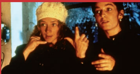
08.01. JENSEITS DER STILLE Al di là del silenzio di Caroline Link, Germania 1996, 109'

Lara, che si distrae tra i problemi del diventare adulta, deve anche fare i conti con quello che, per un'aspirante musicista, sembra essere un ostacolo in più: avere due genitori non udenti. Fin da piccola Lara è stata il loro tramite con il mondo esterno: li accompagna in banca per le trattative sul mutuo, traduce per la madre i film d'amore in tv, e cerca di trasmettere al padre, in gesti, il suono del fioccare della neve. A nutrire la sua passione per la musica c'è la zia, clarinettista jazz. Candidato all'Oscar e premiato in tutto il mondo, il film d'esordio di Caroline Link è stato uno dei primi ad affrontare il tema della disabilità in termini moderni e senza pregiudizi.