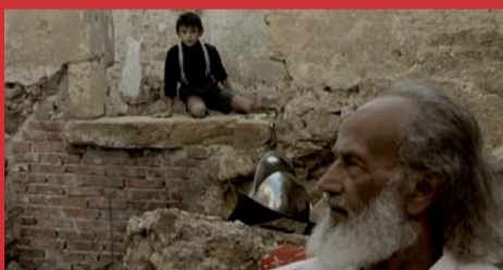
19.02. IL VIAGGIO DI MALOMBRA di Rino Marino, Italia 2012, 90'

Jakob cavalca l'onda del successo come regista teatrale, quando diventa cieco in seguito ad un incidente automobilistico. Disperato, senza prospettive e senza speranza, rifiuta ogni tipo di aiuto, anche quello di Lilli, insegnante per non vedenti, cieca sin dalla nascita. Jakob ha un solo scopo: far visita ancora una volta alla madre in fin di vita in Russia. Lilli prende parte a questo viaggio contro la volontà di lui. Inizia così un'odissea attraverso l'Europa, durante la quale il giovane riconosce la validità di una verità trita e ritrita: "Si vede bene solo col cuore". Una sapiente regia e l'intensa interpretazione dei due attori principali rendono "Erbse auf halb 6" una pellicola stimolante a livello emotivo e intellettuale.