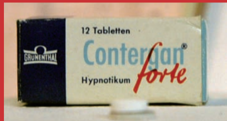
12.02. CONTERGAN - TEIL 2 Effetti collaterali - Seconda parte di Adolf Winkelmann, Germania 2006, 90'

In una casa di cura di Brema vivono e lavorano tre disabili: Hilde, Philip e Karl. Stanchi dei mille problemi da affrontare ogni giorno e del loro supervisor Enno, partono all'insaputa di tutti per Colonia, continuando poi il viaggio fino a Parigi. Il film si presenta come una critica al sistema delle case di cura, ma è soprattutto un ritratto sensibile di tre personalità coraggiose e brillanti. Un'opera eccentrica e sorprendente, interpretata con charme, naturalezza e autoironia da attori disabili provenienti dal laboratorio teatrale d'avanguardia Blaumeier Atelier.