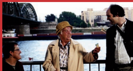
22.01. VERRÜCKT NACH PARIS Pazzi per Parigi (t.l.) di Eike Besuden, Pago Balke, Germania 2001, 91'

Questa commedia "on the road" vede protagonista un insolito gruppo di giovani alla disperata ricerca della libertà. Vincent soffre della sindrome di Tourette, Marie è anoressica e Alex ossessivo-compulsivo. In fuga dalla clinica che li ospita loro malgrado, si ritroveranno in viaggio insieme verso l'Italia, guidati dal sogno di Vincent di vedere il mare. Per la regia di Ralf Huettner, questo film, narrato da più punti di vista, propone diversi elaborati studi di carattere. Una struttura narrativa convincente, un sottile sviluppo dei personaggi e performances attoriali di spessore, contribuiscono a una visione toccante e coinvolgente.