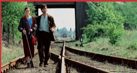
29.01. ERBSEN AUF HALB 6 Piselli alle 5 e 30 (t.l.) di Lars Büchel, Germania 2004, 94'

Lara, che si distrae tra i problemi del diventare adulta, deve anche fare i conti con quello che, per un'aspirante musicista, sembra essere un ostacolo in più: avere due genitori non udenti. Fin da piccola Lara è stata il loro tramite con il mondo esterno: li accompagna in banca per le trattative sul mutuo, traduce per la madre i film d'amore in tv, e cerca di trasmettere al padre, in gesti, il suono del fioccare della neve. A nutrire la sua passione per la musica c'è la zia, clarinettista jazz. Candidato all'Oscar e premiato in tutto il mondo, il film d'esordio di Caroline Link è stato uno dei primi ad affrontare il tema della disabilità in termini moderni e senza pregiudizi.