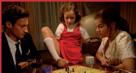
05.02. CONTERGAN - TEIL 1 Effetti collaterali - Prima parte di Adolf Winkelmann, Germania 2006, 90'

Febbraio 2004. Venti bambini si incontrano nella classe quinta D della scuola elementare Fläming a Berlino all'inizio di un semestre scolastico. È una classe in cui bambini con diverse capacità e livelli di apprendimento imparano assieme. Tra questi ci sono anche quattro bambini disabili. Il regista Hubertus Siegert ha accompagnato questa classe per un intero semestre, mostrandoci la vita quotidiana degli alunni proprio dal loro punto di vista, e facendosi testimone di successi e conflitti, di momenti di euforia e di lacrime, di rivalità e di amicizie. Il documentario riesce a restituirci l'immagine complessa e commovente di quel microcosmo particolare che è la vita in una classe.